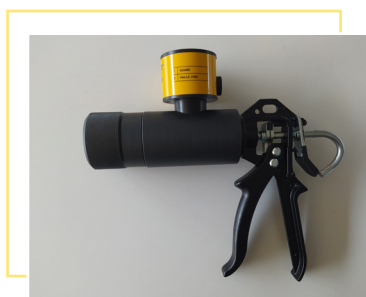
Poignée pour compresser la matière

Une notice d'utilisation est fournie avec le THF-0850.